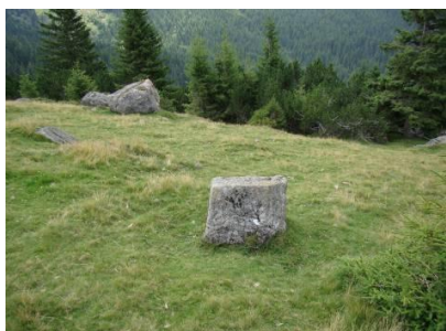
O masă paralelipipedică.

Intervenția umană explică satisfăcător de ce a fost încălcată legea gravitației. Cea mai simplă și ușoară cale de acces în masivul Bucegi este prin Sud, pe lângă peștera Ialomicioara, pe la Piciorul Babelor, însă, exact în această zonă străjuiește o cetate ale cărei ziduri și contraforți se văd foarte clar. Sunt convinsă că pozele susțin cele afirmate de și, de ce nu, le consider incitante pentru a îndemna la un studiu amănunțit și de specialitate ale acestor locuri .