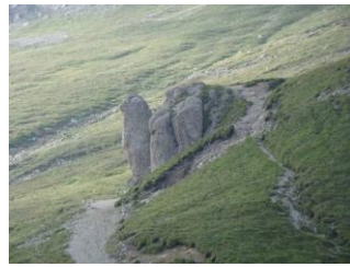
Un cub de granit, rocă foarte rară în Bucegi. „Șoimul”, spre vârful Omu.