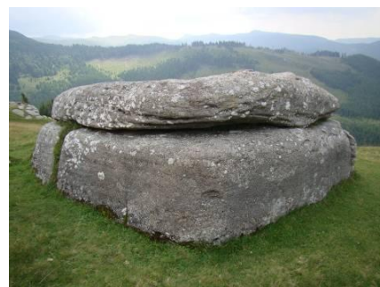
Vântul, ploaia a tocit colțurile cândva drepte.