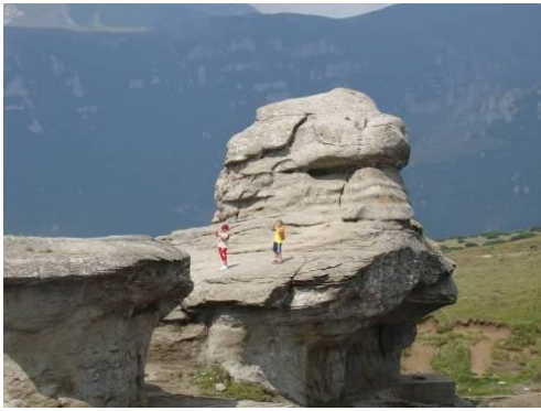
„Păzitorul” Platoului Babelor. locașurile celor șase mușchi oculari.