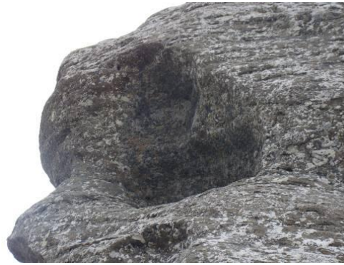
Detaliu al ochiului „Sfinxului”. Se poate vedea că „vântul a săpat și